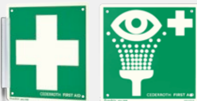
SKYLTFÖRSTA HJÄLPEN-KORS REF 1738

Dubbelsidig och efterlysande. 20 x 20 cm.