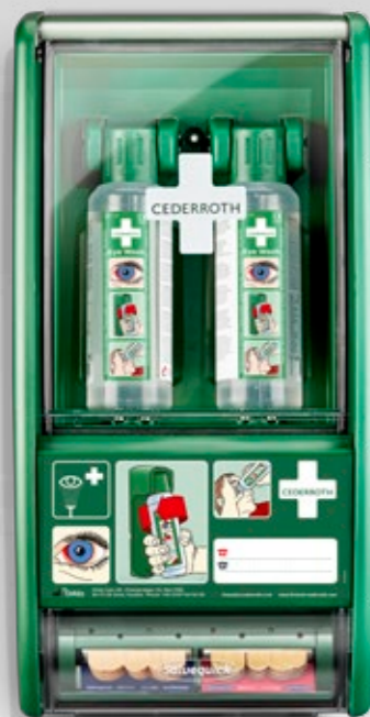
CEDERROTH ÖGONDUSCHSTATION REF 721500

Innehåller: 2 Cederroth Ögonduschflaskor à 500 ml (REF 725200) 1 Salvequick Plåsterautomat inkl. 45 Salvequick Plastplåster (REF 6036) 40 Salvequick Textilplåster (REF 6444) 1 Ögondusch-instruktion 1 Refillnyckel