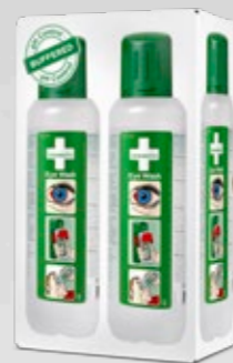
CEDERROTH ÖGONDUSCH REF 725200

Självhäftande skylthållare i plast för montering som flaggskylt.