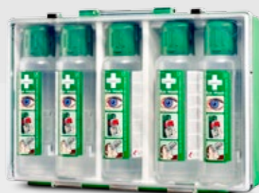
CEDERROTH ÖGONDUSCHVÄSKA REF 7255

2 st (x 500 ml) steril buffrad isoton saltlösning utan konserveringsmedel för engångsbruk. Flaskans mått: 6,5 cm x 23,5 cm. Hållbarhetstid 4,5 år.