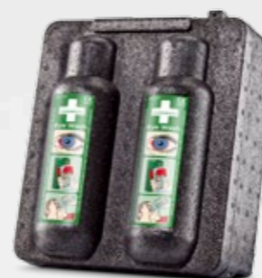
CEDERROTH VÄRMESKÅP REF 790400

Värmeskåpet är avsett för förvaring av två flaskor Cederroth Ögondusch i kalla miljöer. Skåpet håller ögonduschväskaans temperatur på +20°C vid omgivande temperatur ned till -20°C. Det fungerar automatiskt vid både 12V och 24V utan ytterligare tillbehör (med transformator även vid 230 V). Stickpropp för cigarettändaruttag i bilar och lastbilar. Spännings-vakt. Elsäkerhetstest och CE-märkt. Ögondusch beställs separat (REF 725200).