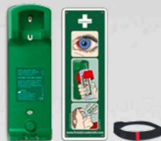
CEDERROTH VÄGGHÅLLARE REF 7200

Hölster i grön nylon med bälteshålla till Cederroth Ögondusch i fickmodell (REF 7221). Mått: B 8 x H 16 x D 4,5 cm.