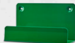
CEDERROTH VÄGGHÅLLARE REF 190400

Ger extra stöd vid placering i skakig miljö, t.ex. lastbilar och truckar.